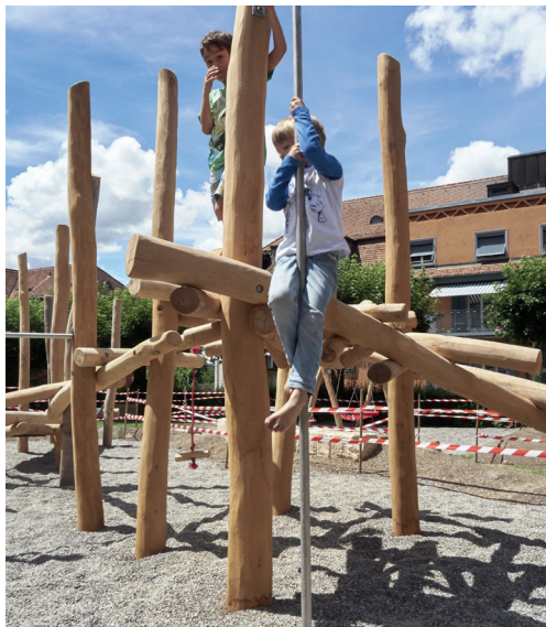
Attraktiver Wohnraum für alle Generationen