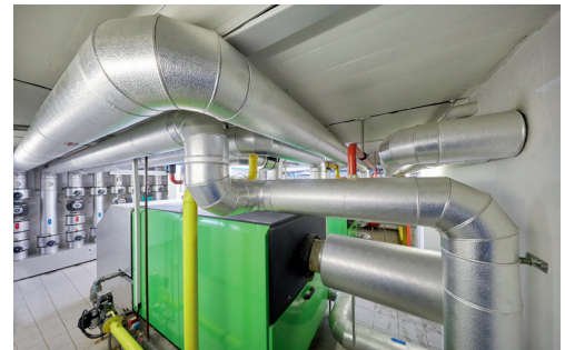
Betrieb und Unterhalt aus eigener Kraft