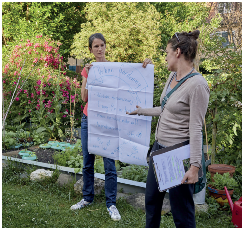
Mitwirken, Entscheiden und Umsetzen